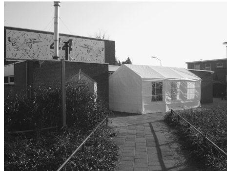
Uitbreiding ingang bij evenement