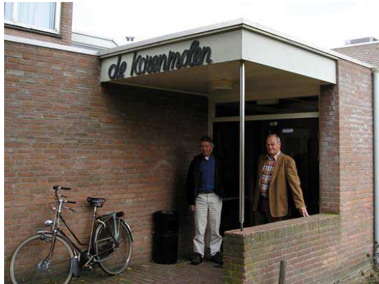
Foto entree Dorpshuis

In het gebouw is één invaliden toilet, twee dames toiletten, een heren toilet en 3 urinoirs. Uitvoering van deze ruimtes is sober doch functioneel, aantal is voor gebruik als Dorpshuis voldoende, echter niet in combinatie met grote evenementen, het aantal toiletten is dan onvoldoende. Het Dorpshuis beschikt niet over een garderobe, in de hal is een beperkte kapstok in vaste opstelling.